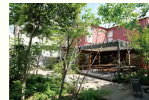
PARLAND COFFEE 〒670-0871 兵庫県姫路市伊伝居8