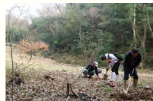
ストックヤードの様子