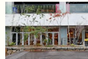
姫路駅前キャスルガーデン 〒670-0927 兵庫県姫路市駅前町188-4