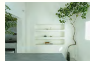
lyhty(リフト)建築設計事務所 「枝もの」としての活用もできます。