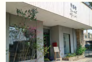
東播磨フィールドステーション 〒675-0003 兵庫県加古川市神野町神野690-1