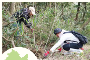
播磨地域 加古川市 志方町広尾西 山採りの様子